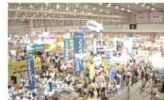
1978 第一回「グラッドフェア」開催