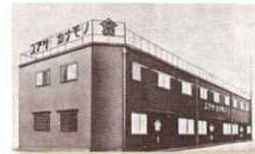
1940 「湯淺金物株式会社」に商号を変更