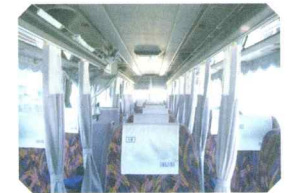
3列独立リクライニングシート

神戸・大阪方面への都市間高速バスを定期運行。 3列独立リクライニングシートで、ゆっくり足を伸ばし、 隣を気にすることなく、長距離のバスの旅をご利用いただけます。