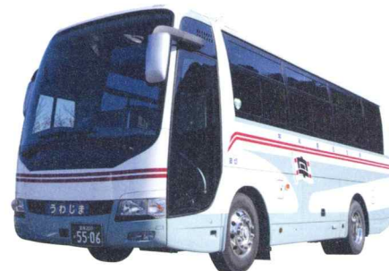
中型セミサロンタイプ