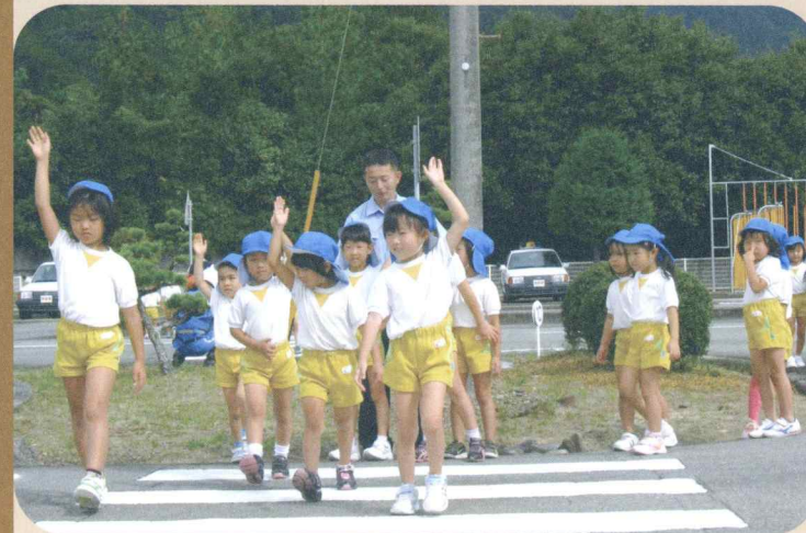
幼稚園児の交通安全教室