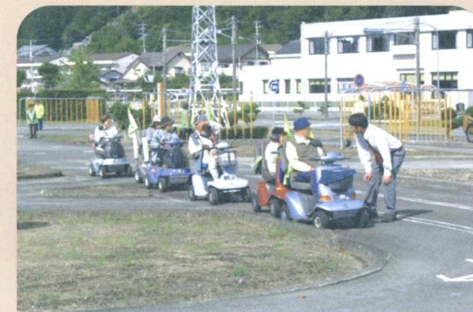
電動車いす交通安全教室