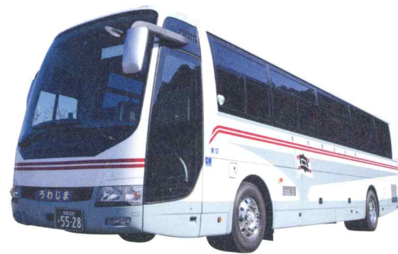
大型セミサロンタイプ

当社貸切バスは、「貸切バス事業者安全性評価認定制度」『SAFETY BUS』三ツ星の認定を受けています。