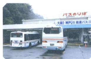
宇和島バスセンター