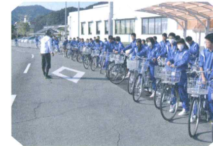
高校生の自転車交通安全教室