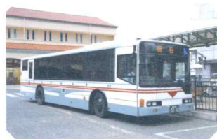
〈宇和島～宿毛線〉 低床ノンステップバス

運行エリアは、松山市から 高知県宿毛市にわたる国道56号線 および並行する高速道路を幹線として、 愛媛県南予地域を中心に 多数の路線網を張り巡らせております。