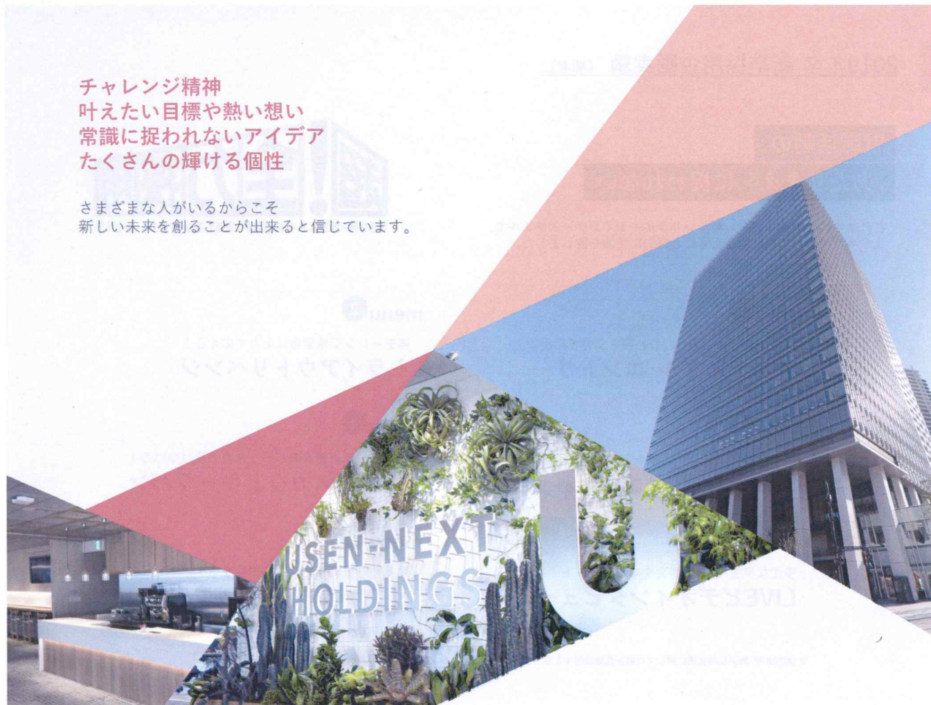
Uno Yasuhide 宇野 康秀