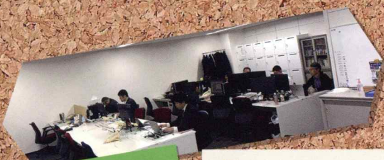
アクト・ブレーン