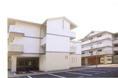
無田ヶ原口市営住宅