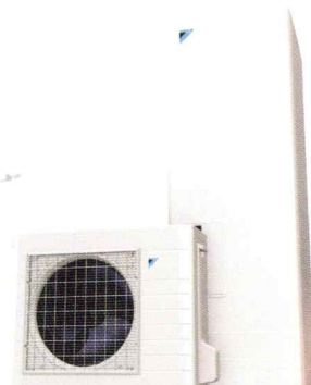
自然冷媒(CO 2 )・ヒートポンプ給湯機 エコキュート