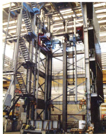
立柱式溶接ロボット