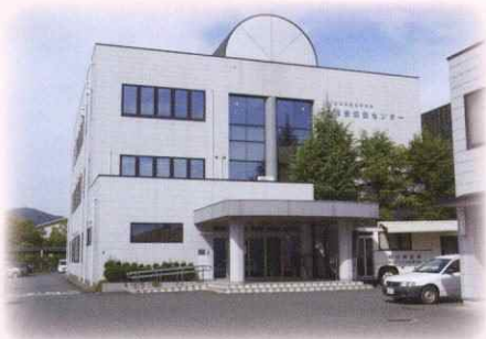
総合保健センター