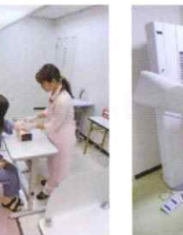
マンモグラフィー