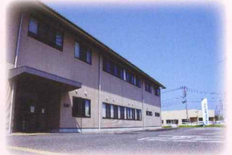
西部健康管理センター