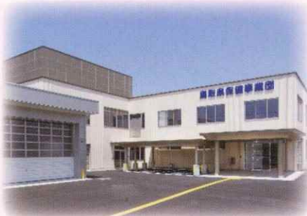
中部健康管理センター