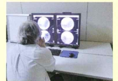
デジタル撮影・デジタル読影