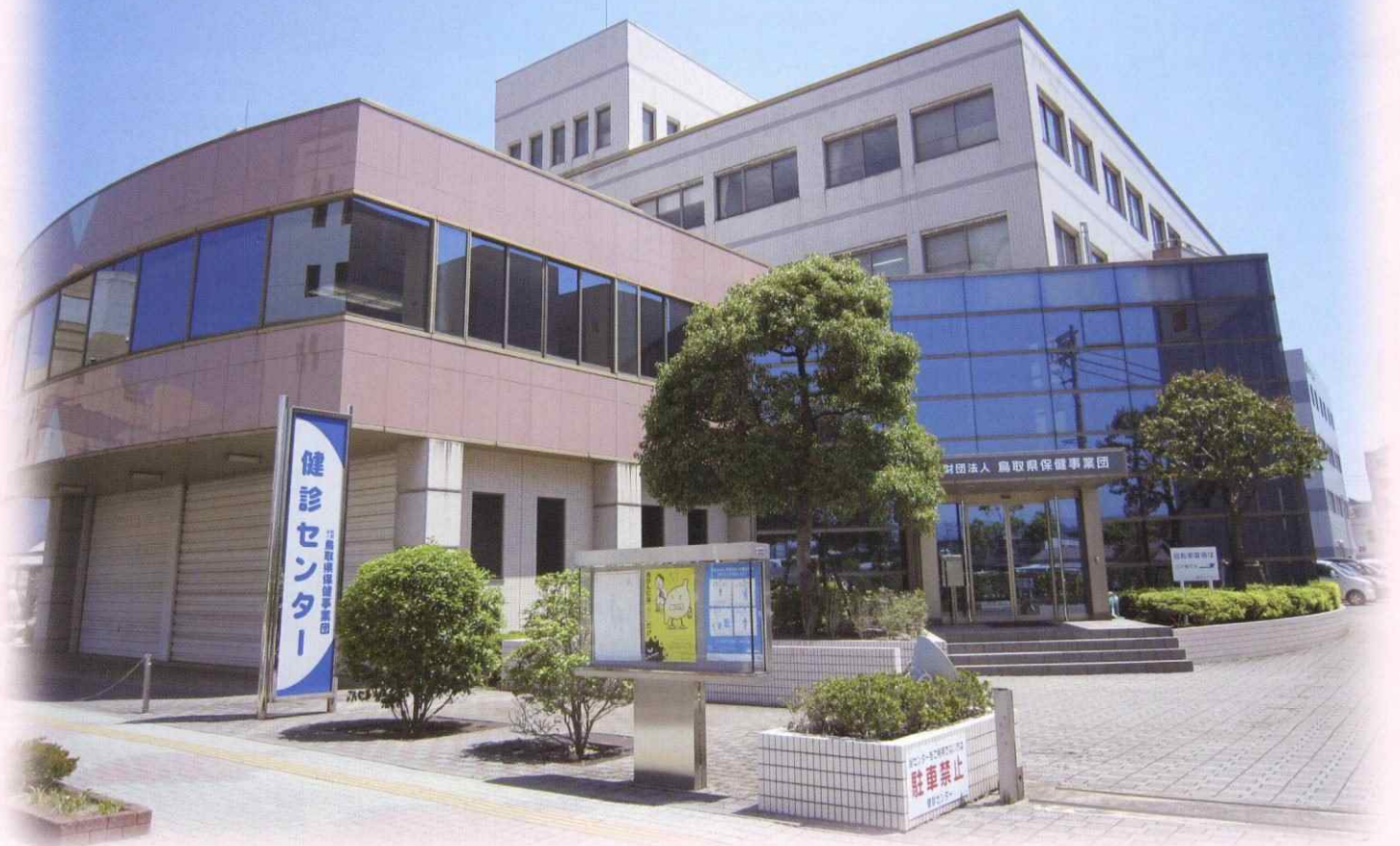
本部 健診センター