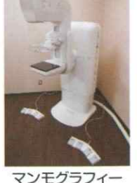
マンモグラフィー