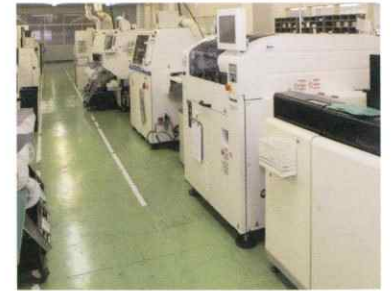
電子部品実装ライン