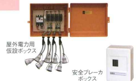
屋外電力用 仮設ボックス