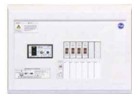
分岐横一列タイプ