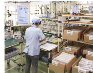
住宅用分電盤組立(セル)