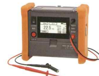
漏電遮断器・漏電火災警報器テスター LT-1B