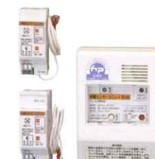
感震センサーユニット ES