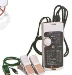
抵抗分漏れ電流測定用 ユニット RM-1