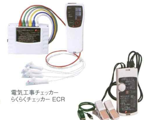
電気工事チェッカー らくらくチェッカー ECR