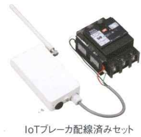
IoTブレーカ配線済みセット