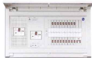
太陽光発電システム対応