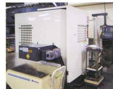
マシニングセンター