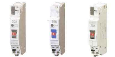
パルテクト漏電ブレーカ パルテクトあんしんブレーカ パルテクトブレーカ