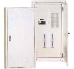
分岐パルテクトブレーカ組込