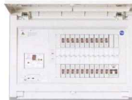
燃料電池システム対応