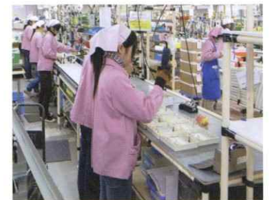
住宅用分電盤組立(ライン)