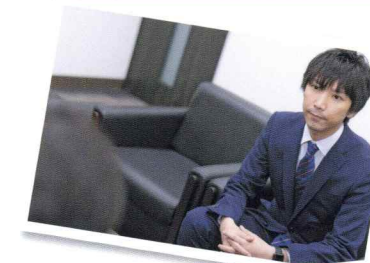
職場の雰囲気はみんなが明るくて毎日楽しいです

一言：私のように総合職で地元以外での経験を積んできた者だけではなく、地元で暮らしながらもマネージャーとして活躍している社員も多くいます。ぜひ自分に合ったライフスタイルでチャンスを掴んでください！