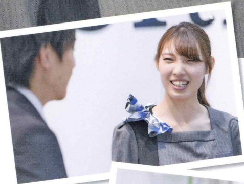
結果が目に見えるから頑張れます！