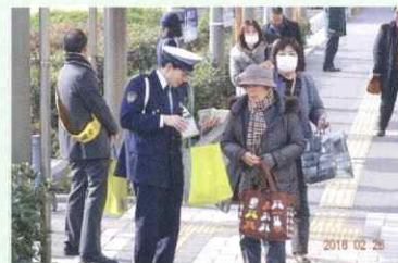
交通安全啓蒙活動

当社では、定期的な鍋会を実施。和気あいあいとした雰囲気の中で語り合い、社員同士の親睦を深めています。