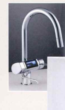
〈日本トリム〉連続生成型電解水素水整水器