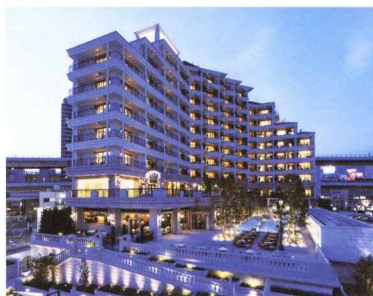
ホテル ラ・スイート神戸ハーバーランド