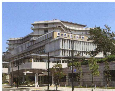
兵庫県立子ども病院