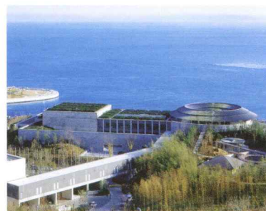
淡路夢舞台国際会議場