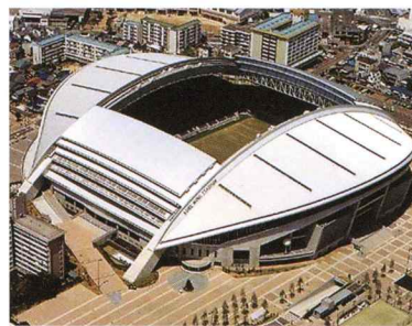
ノエビアスタジアム神戸