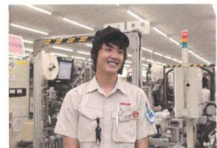
【自動機オペレーター】

【問い合わせ先】 益田工場：総務課(堀) 〒698-2144 島根県益田市虫追町口320-54(石見臨空パーク内)