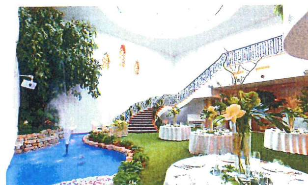
水と緑と光のリゾートウエディング。 クラブハウス セフィロト SEPHIROTH 岡山市北区北長瀬表町1-831-1 tel.086-805-8855