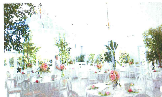
森の中のような館内で、ナチュラルウエディング。 クリスタルテラス ナチュレ crystal terrace Nature 岡山市北区北長瀬表町1-4-10 tel.086-244-1311