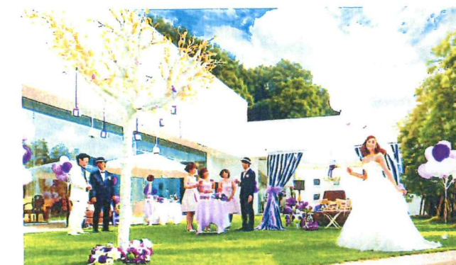
世界最高峰のデザイナーによるアートウエディング。 ザ・ラインズ THE LINES 倉敷市新田1289-3 tel.086-434-3737