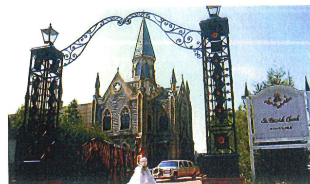
大聖堂の本格正統派ウエディング セント・パトリック教会 St.Patrick Church 岡山市中区浜3-8-55 tel.086-271-1551