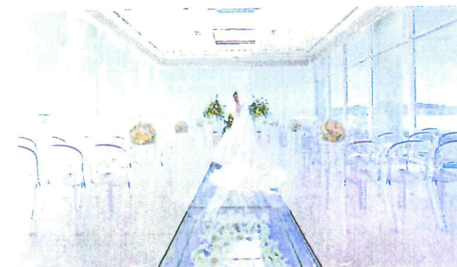
空と光に包まれたスカイ・ウエディング。 ナチュラルウエディングテラ NATURAL WEDDING TERRA 岡山市北区北長瀬表町1-3-12 tel.086-805-6575