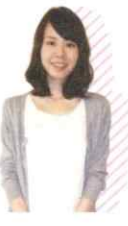
クサカヘトミ 2015年度新卒社員

ミラエールを選んだきっかけは、カウンセリングを行い自分の将来を考えた就業先を紹介していただける点です。キャリアカウンセラーの方に、不安なことは何でも相談できました。事務職としてのスキルアップをサポートする制度があったことも大きかったですね。ミラエールで学んだひとつ上のビジネススキルを職場で活かしたいと思っています。