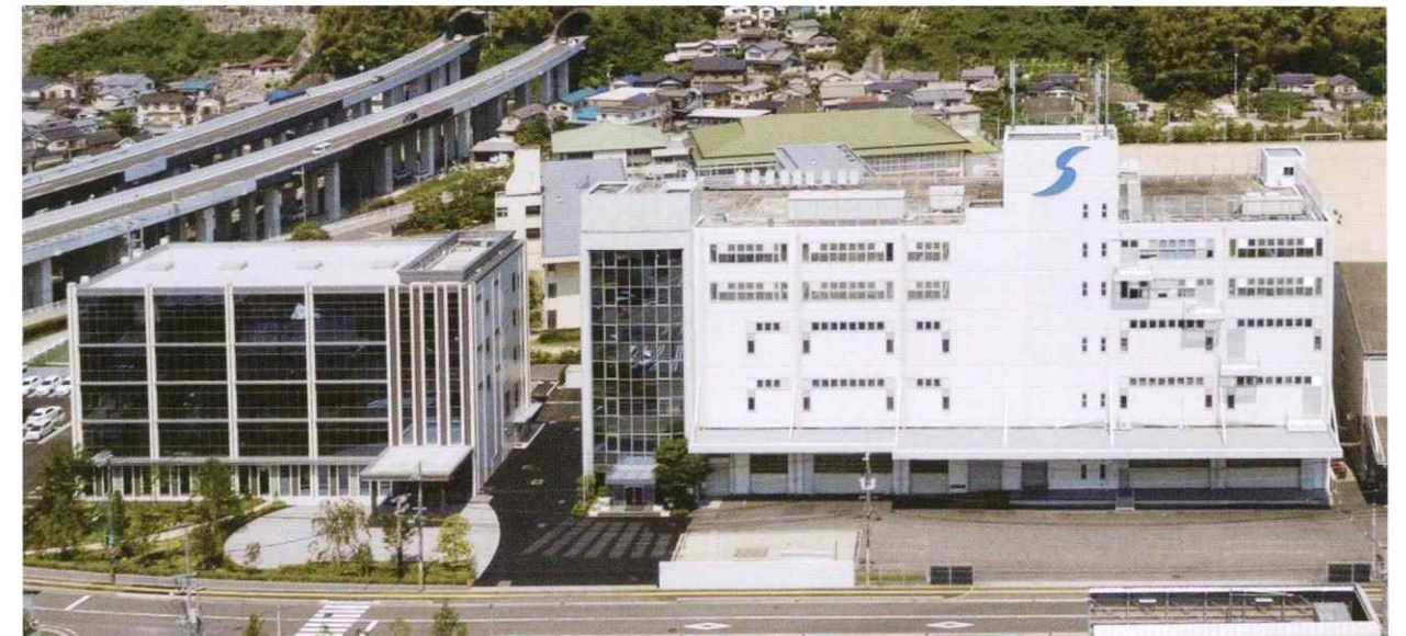
■本社 新館及び本館 広島県安芸郡坂町横浜中央一丁目6番30号 TEL.082-820-1111 (代表) FAX.082-280-1112