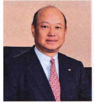
株式会社 シマダオール 代表取締役社長

お客様に信頼され評価いただく為には、どんな小さな問題も見逃さない一分の隙もないサービス、ご企業各社またお客様各人のニーズに合った情報提供を心掛け、常によりよいものを提案していくことが重要になります。お客様がプロである以上、全社員がプロ、取扱商品もプロ向けでなくてはならない。すべてにおいてプロフェッショナルの集団。それがシマダオールの目標であり使命であると考えております。