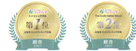
「みんなのウェディング」Webサイト https://www.mwed.jp/

全国的に人気のウェディング情報サイト「みんなのウェディング」広島県総合口コミランキングで、2年連続で当社が手がける「ルメルシェ元宇品」が1位、「ザ サウスハーバーリゾート」が2位を獲得しました!都道府県単位(広島県は全122件の式場・ホテルが掲載)で、一つのグループが1位2位を独占するのは全国初の快挙です。「一人でも多くの人に幸せを。世界に拍手喝采の波を、もっと。」そんな思いが伝わって、多くの新郎新婦様が私たちのことをおすすめしてくださった大変光栄な結果です。