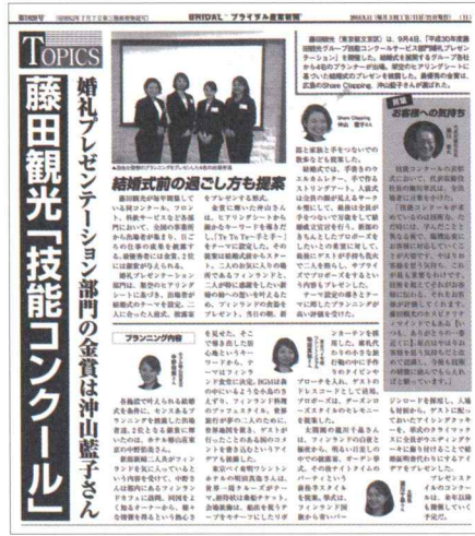
全国のブライダル業界の動向を報じる「ブライダル産業新聞」にも大きく取り上げられました。