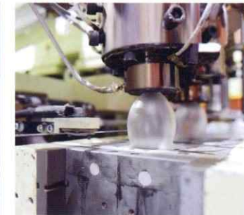
ダイレクトブロー成形