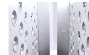
エアシャワー完備