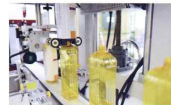
シュリンクラベル加工