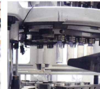
1ステージ二軸延伸ブロー成形