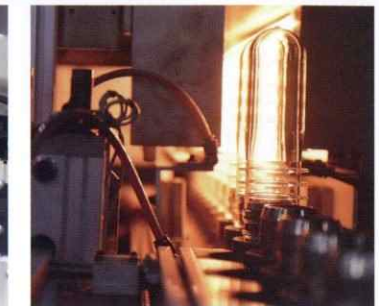
2ステージ二軸延伸ブロー成形