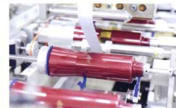
印刷ホットスタンプ加工