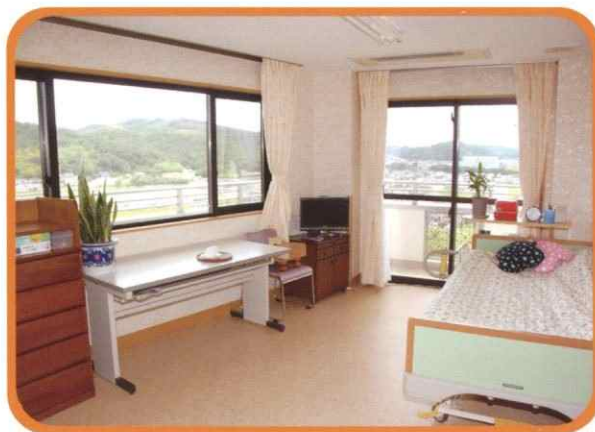
広々とした居室（約8畳）をご提供します。