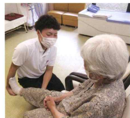
● リハビリ 機能訓練指導員の指導のもと、個別のプログラムに添った機能訓練を行います。