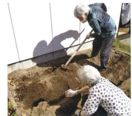
● 農園活動 頭や体を使ったレクリエーションの他にも、クラブ活動・季節行事・おでかけ行事など、たくさんの行事をみなさん楽しんでます。