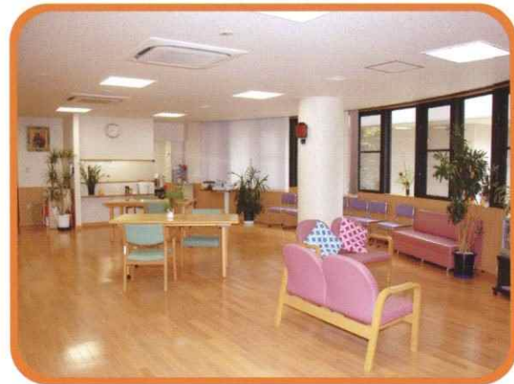
家庭に近い雰囲気の中、落ち着いた空間を演出します。