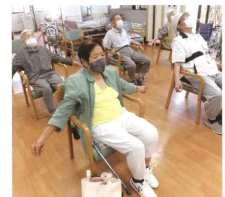
● 朝のつどい 呼吸法。舞リハ・健口体操・ビデオ体操 etc…音楽に合わせて楽しく運動を行ないます。

和やかな雰囲気の中、心豊かに楽しい一日を過ごしていただけるよう、真心込めたサービスを提供させていただきます。