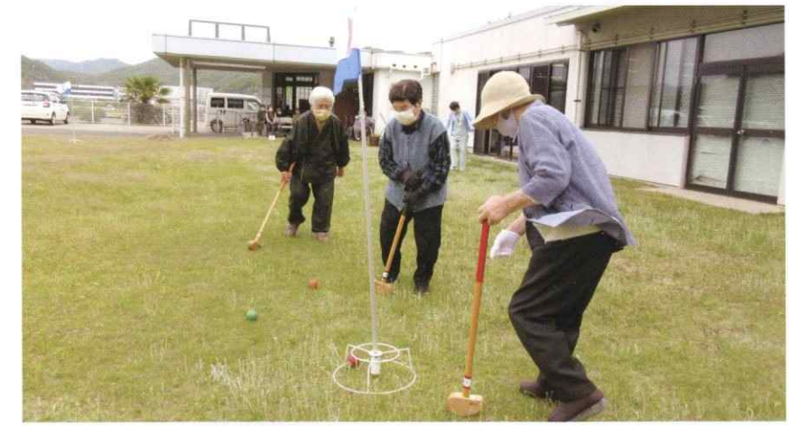
● 芝生広場（グランドゴルフ場） 施設利用の方に限らず、"地域の方の広場"として、多種多様な行事に応じて、大勢の方に楽しんでいただけるようご提供します。