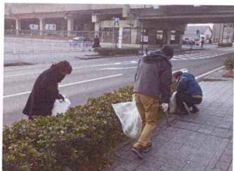
ボランティア清掃