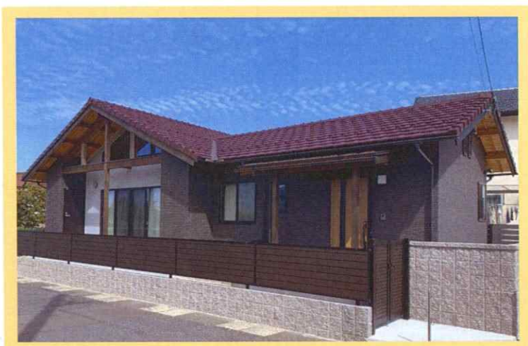
Y様邸新築工事（2022年6月完成）