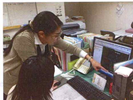
CADを使用しての図面作成