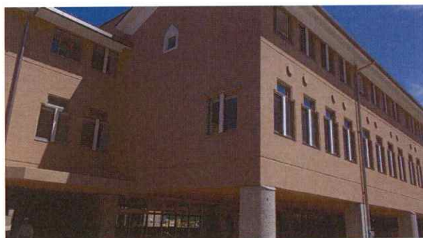
島根県立大学出雲キャンパス （出雲市西林木町）