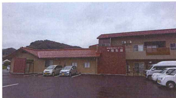
特別養護老人ホーム偕生園（浜田市黒川町）