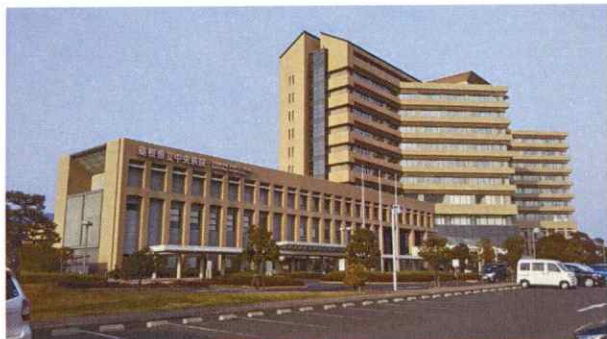
島根県立中央病院（出雲市姫原）