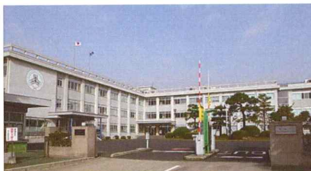
松江工業高等専門学校（松江市西生馬町） ライフライン再生工事