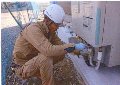
エコキュート設置作業