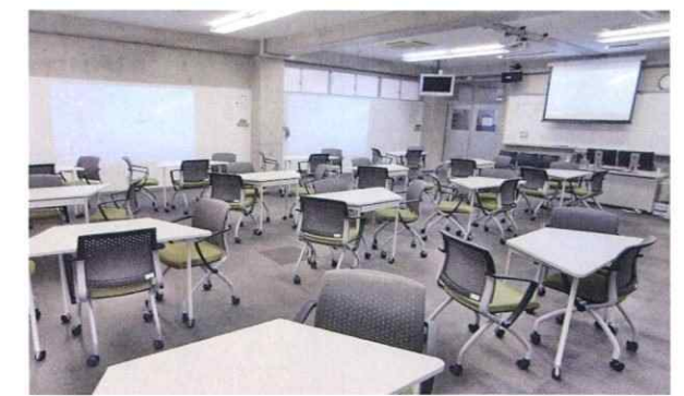
アクティブラーニングを推進するため導入されたICT教室(学校法人呉武田学園様)