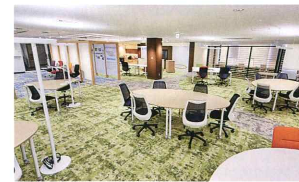
アクティビティ・ベースド・ワーキングの考え方を取り入れた当社オフィス