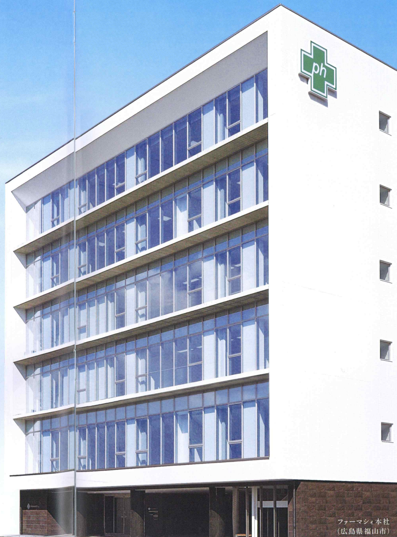
ファーマシィ本社 (広島県福山市)