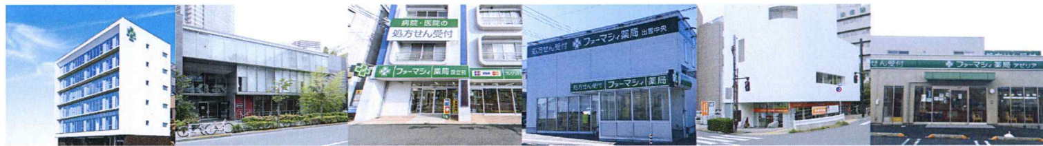
本社(広島県福山市) 東京支店(東京都目黒区) ファーマシ薬局国立前(広島県福山市) ファーマシ薬局出雲中央(島根県出雲市) 恵比寿中央薬局(東京都目黒区) ファーマシ薬局アゼリア(和歌山県和歌山市)