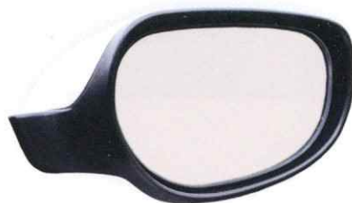
電動格納式ドアミラー