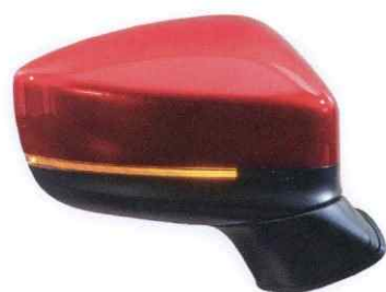
高付加価値ミラー