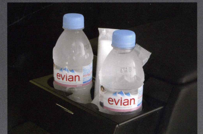
ミネラルウォーター