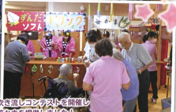
仙台七夕祭りでおなじみの吹き流しコンテストを開催し 名物のずんだソフトや笹かまを提供しました！