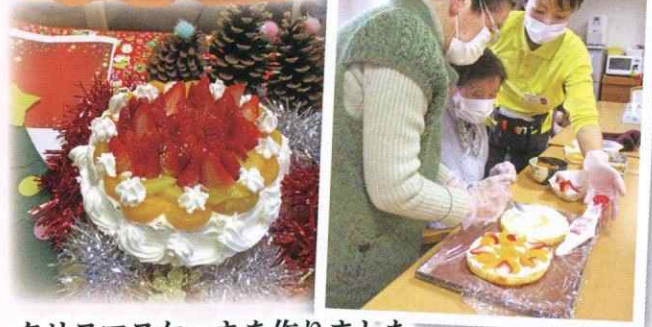
クリスマスケーキを作りました