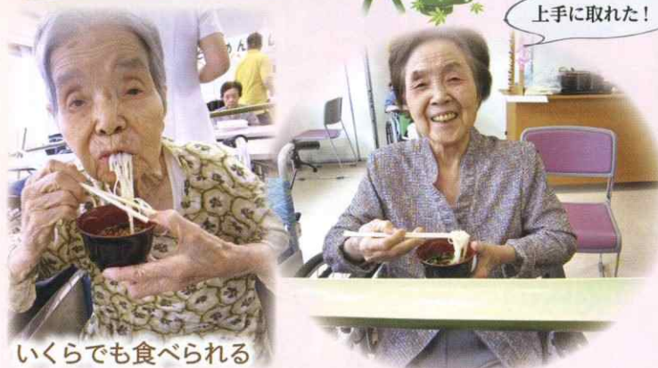
いくらでも食べられる