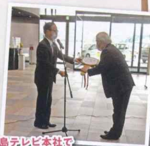
広島テレビ本社で 24時間テレビ車両贈呈式