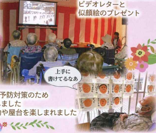
和光園保育所園児によるビデオレターと似顔絵のプレゼント