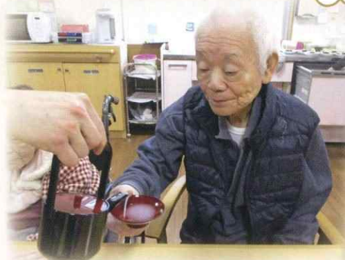
おせちやお屠蘇をみなさんでいただきました また、おみくじや獅子舞で楽しめました