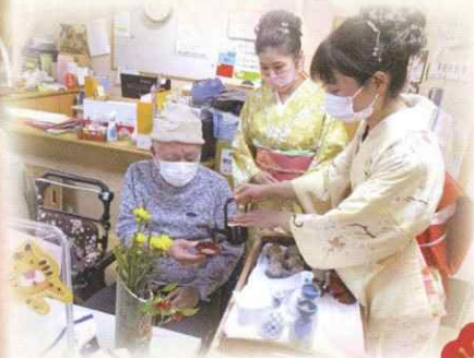
昼食は豪華なお節を いただきました