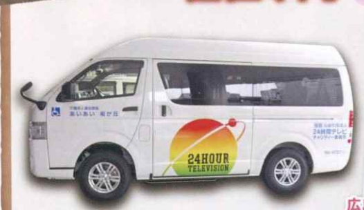
公益社団法人24時間テレビ チャリティー委員会から