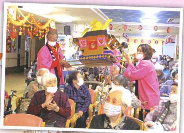
あいあい神輿で お祭りムードが さらに盛り上がりました