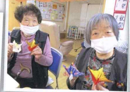
難しい作品にも挑戦!