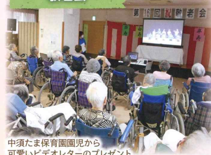
中須たま保育園園児から可愛いビデオレターのプレゼント