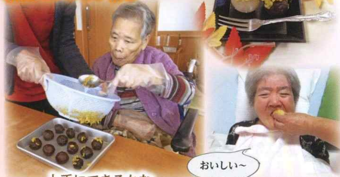
上手にできるかな