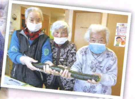
大きな恵方巻、うまく巻けました