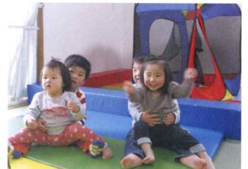
あいあい保育園桜が丘