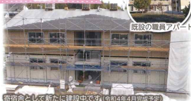
既設の職員アパート 寄宿舎として新たに建設中です(令和4年4月完成予定)