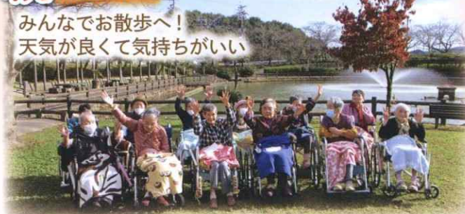
みんなでお散歩へ! 天気が良くて気持ちがいい