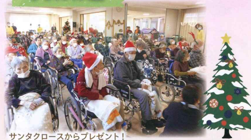
サンタクロースからプレゼント!