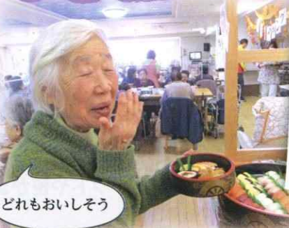
どれもおいしそう