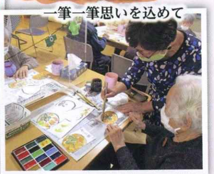
一筆一筆思いを込めて