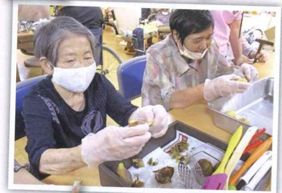
いただきもののイチジクでジャムを作りました 完成したジャムはアイスに添えて提供しました