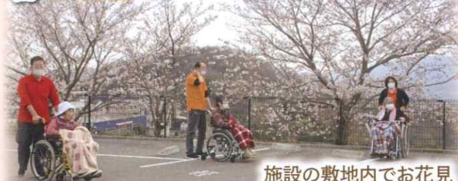
施設の敷地内でお花見綺麗な桜に大満足