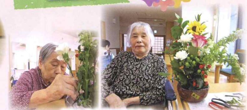
きれいなお花で癒される~