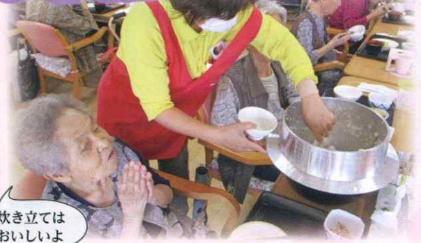
炊き立ては おいしいよ