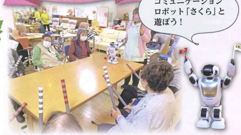
コミュニケーション ロボット「さくら」と 遊ぼう!