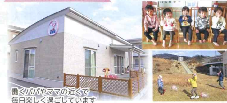
働くパパやママの近くで 毎日楽しく過ごしています