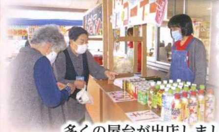
多くの屋台が出店しました