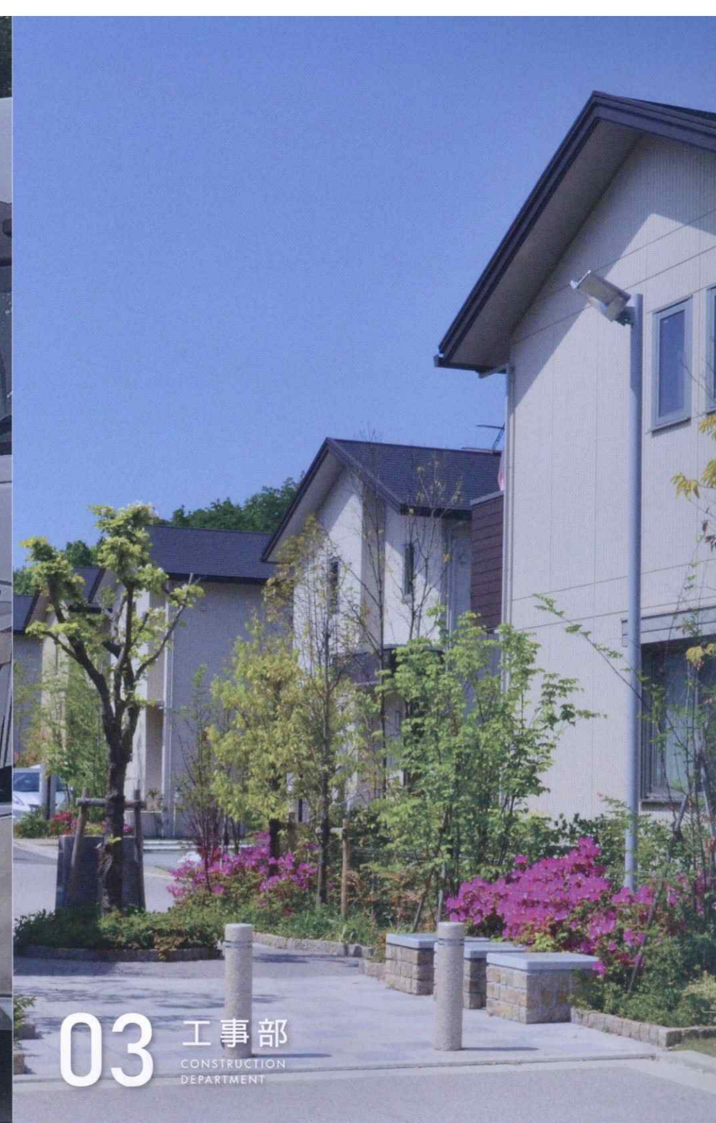
03 工事部 CONSTRUCTION DEPARTMENT