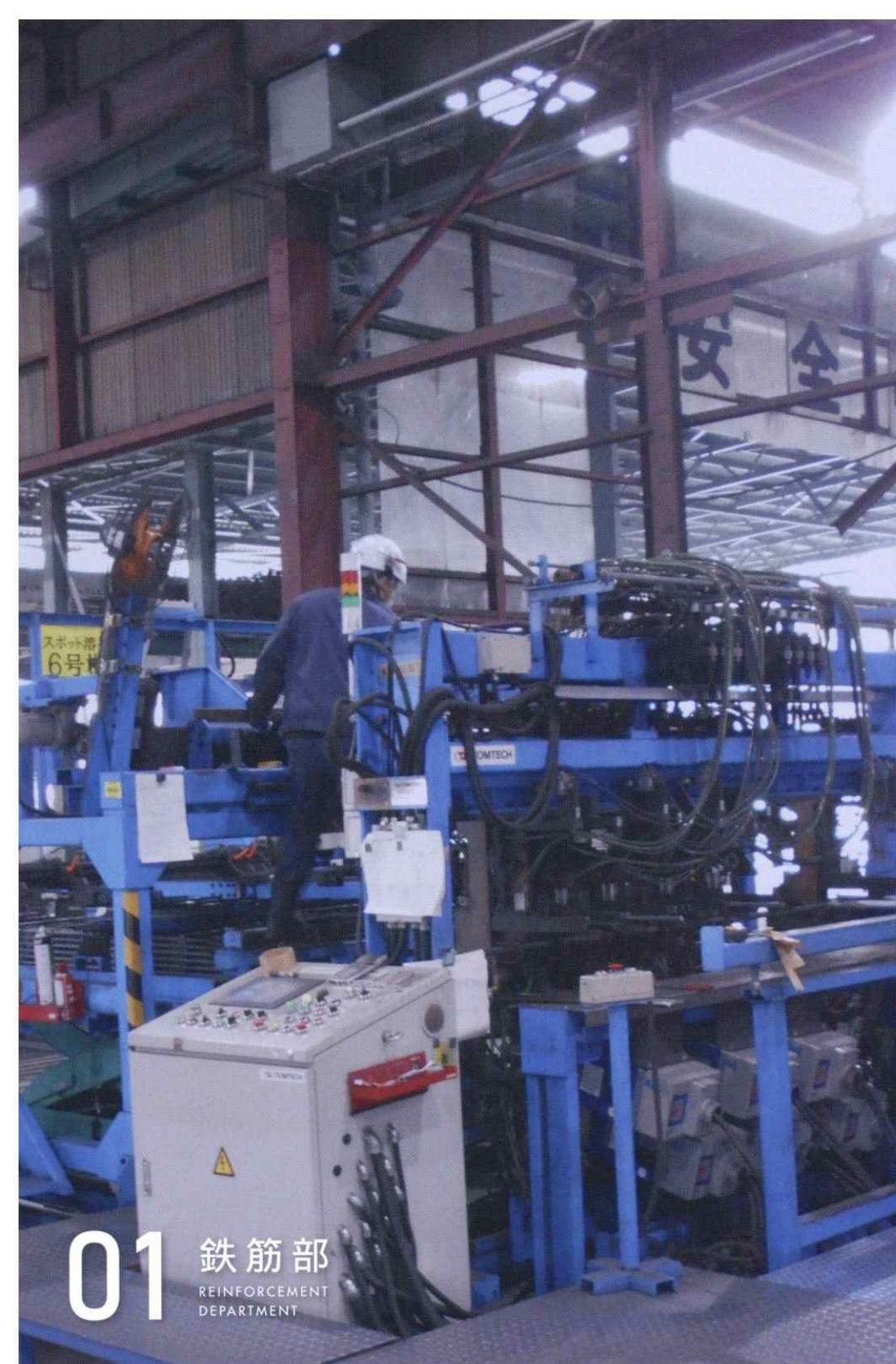
01 鉄筋部 REINFORCEMENT DEPARTMENT