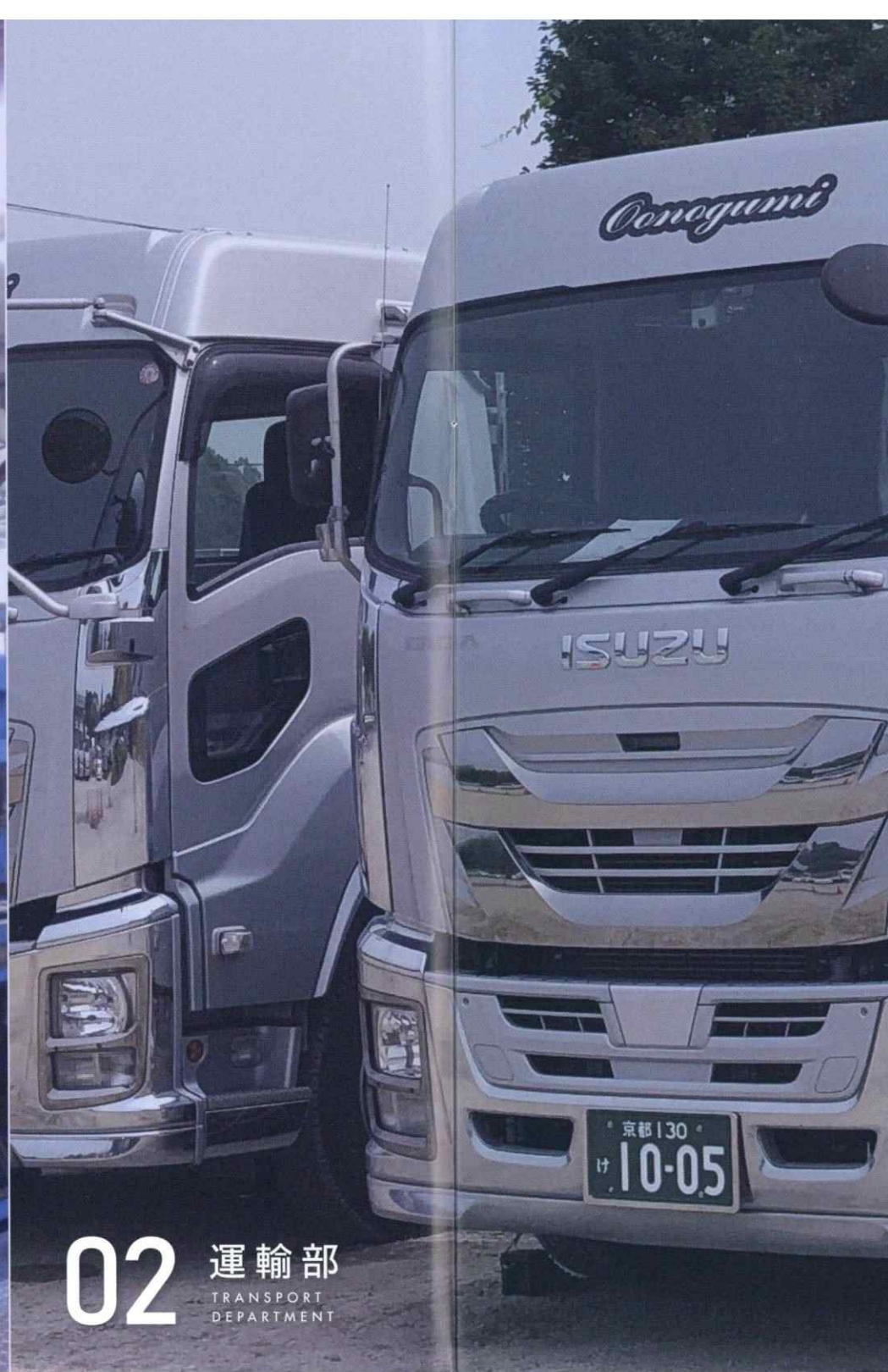
02 運輸部 TRANSPORT DEPARTMENT