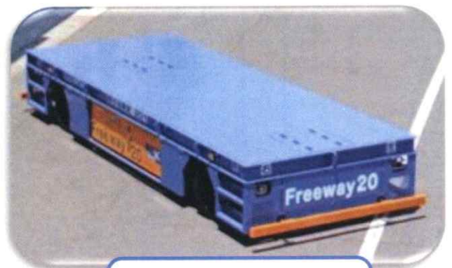
フリーウェイ (重量物搬送台車)