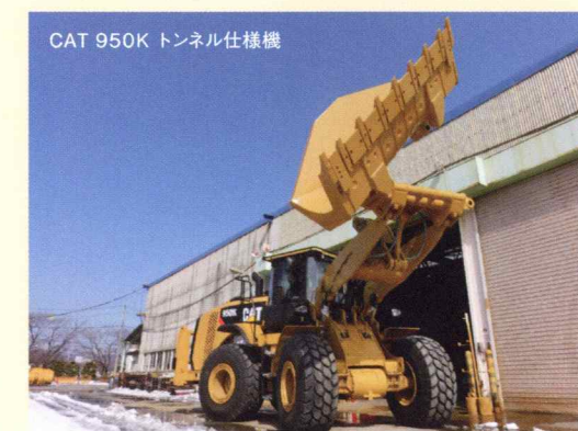
CAT 950K トンネル仕様機

お客様のニーズに応じて、標準機を特別仕様機へ改造するカスタマイズサービスをご用意。林業・解体・無線操縦など利用シーンに合わせた仕様の製品を取り揃えています。