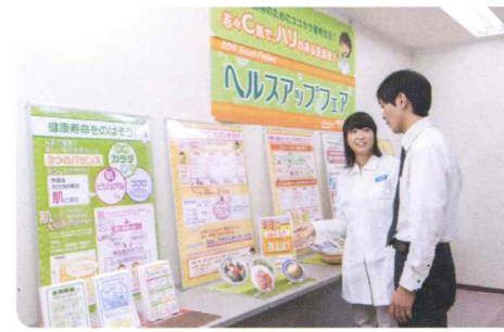
食を通して健康を支える、イベントも行っています

毎日の食事はとても大事で、大きな楽しみでもあります。安心・安全なおいしい食事で、すべてのお客様へ笑顔と活力をお届けするのが当社の使命です!