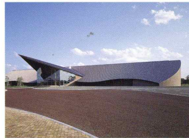
札幌研究開発センター