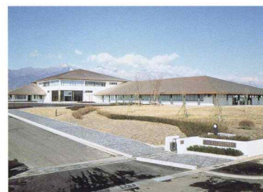
松本研究開発センター