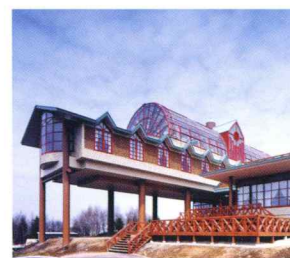
研修施設/大峰研修センター