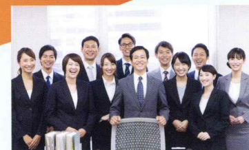
所員10名以上の事務所