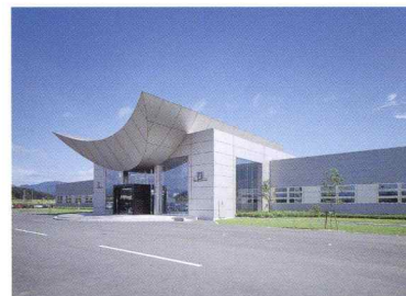
郡山工場・郡山研究開発センター