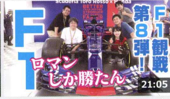
F1 を間近で見たら 35 歳の大人が 8 歳の子供になった話。 209万 回楽しい・5日前