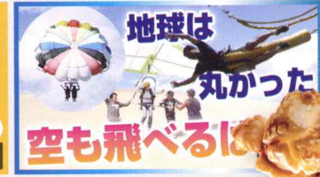
【飛んで速報】地面に飽きたので色々な方法で空を飛ん ... 129万 回楽しい・1か月前