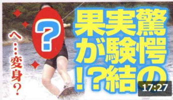
【実験】ウェイクボードをすれば誰でもカッコよく見え ... 158万 回楽しい・1週間前