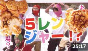
【奇跡】ゴレ○ジャーで滑ると白銀美女に遭遇?! 196万 回楽しい・3週間前