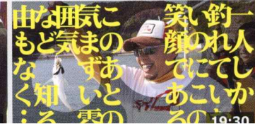
由な押気にもど気まのなく知る