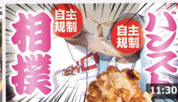
おっさん同士でハンやったら地獄絵図たっ ... 414万 回楽しい・3週間前