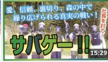
【悲報】密かに社長を狙うとまさかの全員社長狙いだっ ... 245万 回楽しい・2週間前