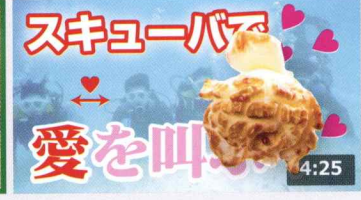
【ワンチャン速報】意中の人と一緒に潜ればもしかした ... 145万 回楽しい・2週間前