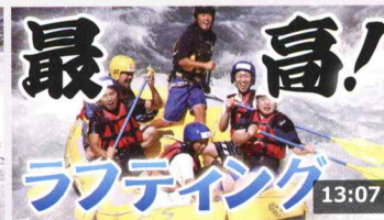
アマゾンの秘境を感じに出掛けたら、いつの間にか北海 ... 400万 回楽しい・1か月前