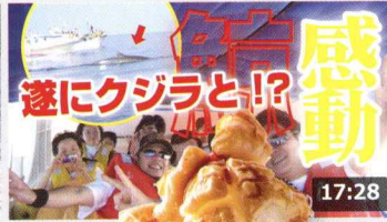
【感動検】と誰でも心が ... 検証 ... 139万 回楽しい・1週間前