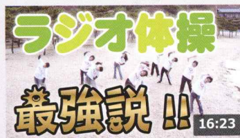
体力作りにラジオ体操してみたら逆に体力奪われた件 129万 回楽しい・1か月前