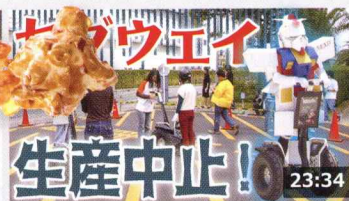
【超悲報】大人気のセグウェイが生産中止になった【大 ... 295万 回楽しい・3週間前