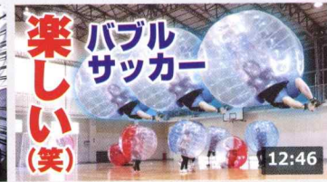
【朗報】バブルサッカーが恐ろしく楽しかったので調子 ... 143万 回楽しい・4週間前