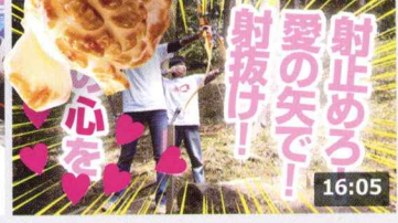
【彼のハートを射抜きたい】だからアーチェリーを練習 ... 134万 回楽しい・1週間前