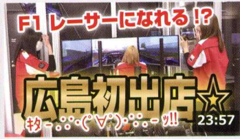
『ドライブシミュレーションカフェ』ってなんなのさ 143万 回楽しい・3日前