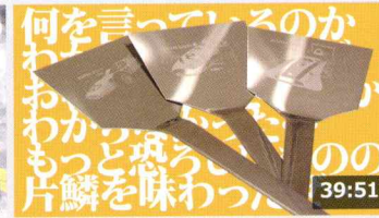
【悲報】レーザー加工機を導入したが全く売れなかった ... 187万 回楽しい・1か月前