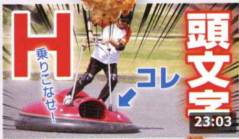
日本で初めてのホバークラフトを輸入してみたたら超 197万 回楽しい・1日前