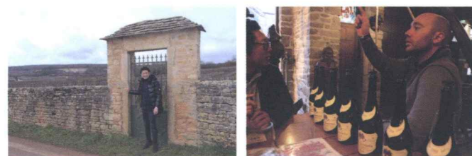
* フランス視察時の写真