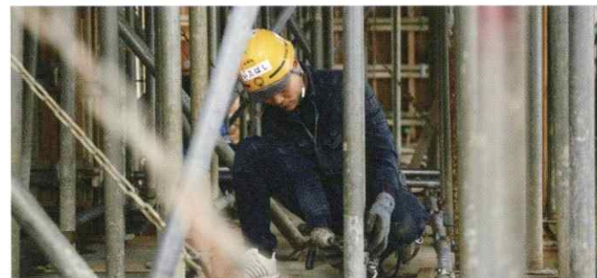
07. 型枠の下にはコンクリートの重さを支える支柱が並びます