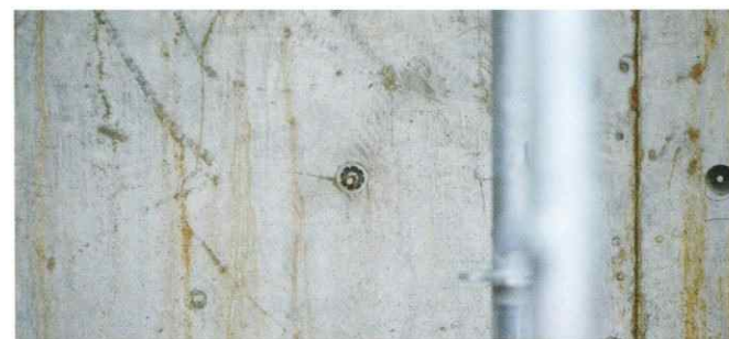
09. コンクリートを流し込んで固めた後に型枠を外す