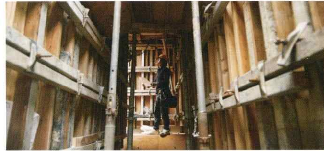
06. 組み上げられた型枠の様子