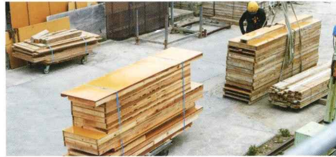
04. 加工した型枠や材料を現場に配送します