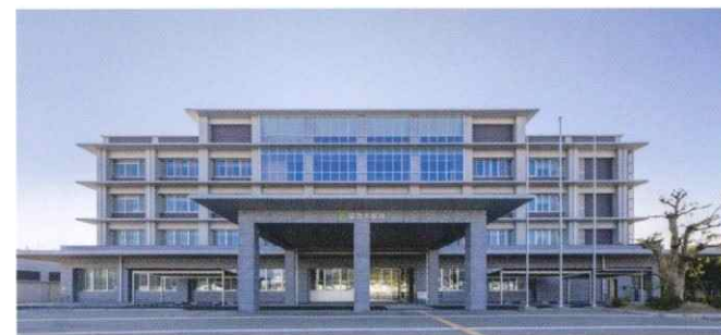
10. 設計図通りの建物が完成