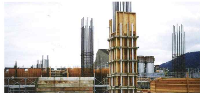
08. 建物の柱となる型枠