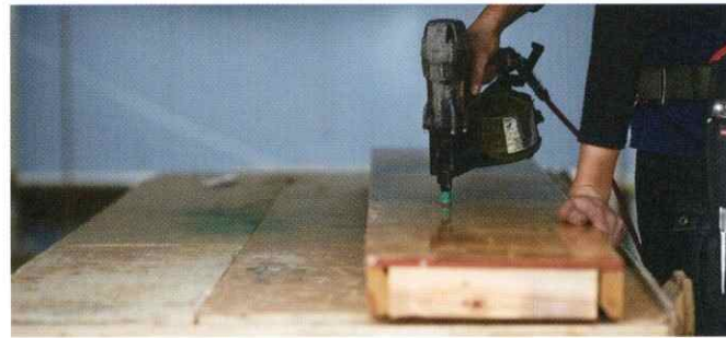
03. 会社の作業場でベニヤを建物の形にカットします