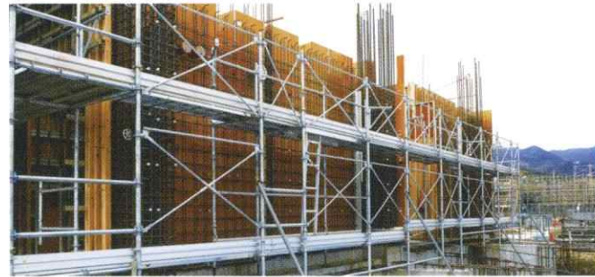
05. 配送された型枠を、建物の形に組み上げます