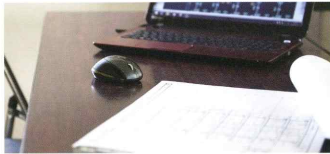
01. 元請業者より図面が届きます