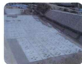
河川用の根固めブロック