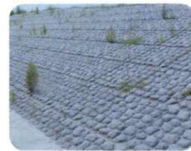
河川用の大型張ブロック