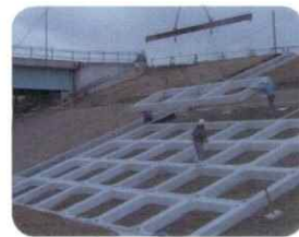
河川の大型の法面ブロック