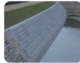
河川用の環境保全ブロック