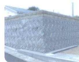
粗面(間知)ブロック