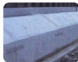
河川の基礎ブロック