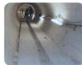
シールド工事のインバートブロック