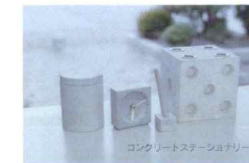
コンクリートステーションアリー

気候変動による自然災害に対応した 防災・減災・強靱化製品の開発と供給 自然災害復旧の迅速な対応(製品・支援活動など)