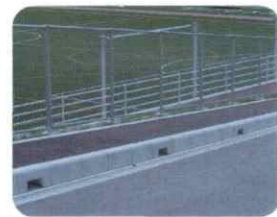
歩道の境界ブロック