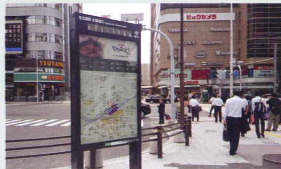
JR名古屋駅 ストリートファニチャー

様々な場所で放映したり、掲載したりする広告の料金収入の一部を自治体や地域に必要な設備等に変えて、当社が整備運用する公共性の高い事業です。 自治体庁舎内のデジタルサイネージや Wi-Fi 機能が付いたマップ広告、地域住民の生活動線の環境を向上させる設備など、様々な形で広告を展開しています。