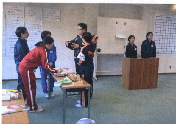
新入社員研修 広島工大沼田校舎