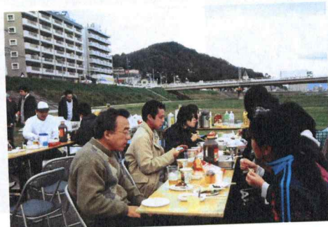
バーベキュー大会