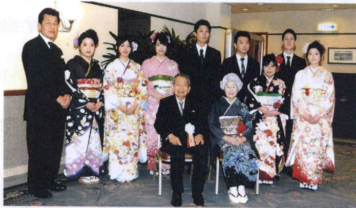
2014年 成人式・表彰式