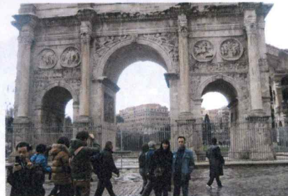
2013年勤続海外旅行 IN イタリア