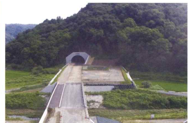
国道313号道路改修工事(神辺トンネル)