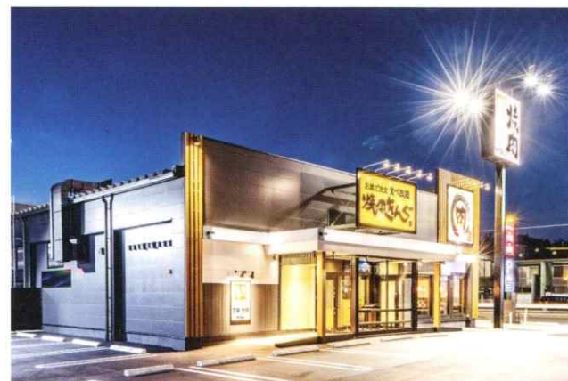
焼肉キング福山王子店 新築工事