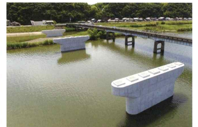
福山沼隈線道路改良工事(3工区)