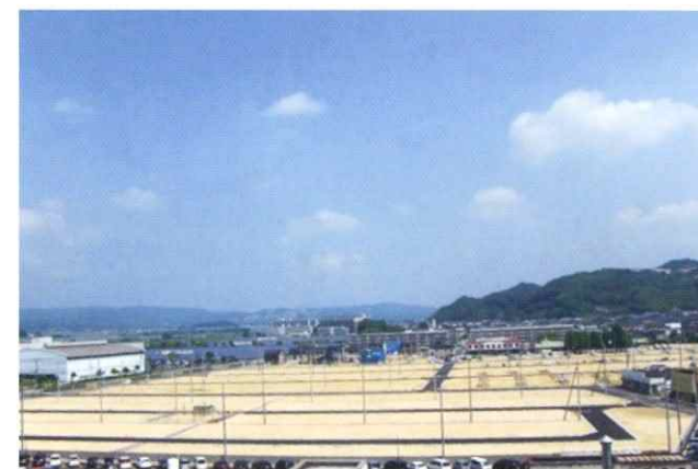
サントウン倉敷鶴の浦第3期宅地造成工事