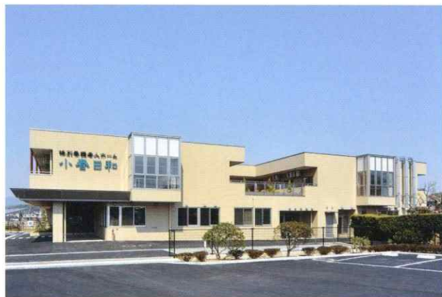
地域密着型特別養護老人ホーム 小春日和 新築工事