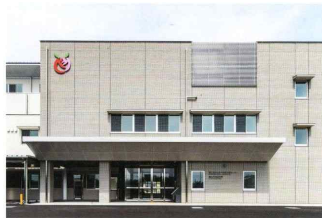
福山市神辺地域交流センター 建設工事