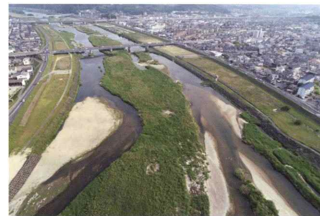
芦田川中流維持工事