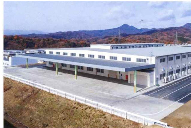
株式会社北川鉄工所 福山工場加工棟 新設工事