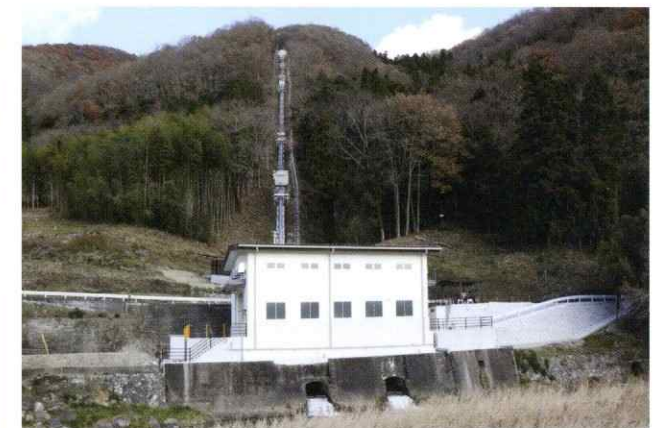
山野発電所 土木関係改修工事