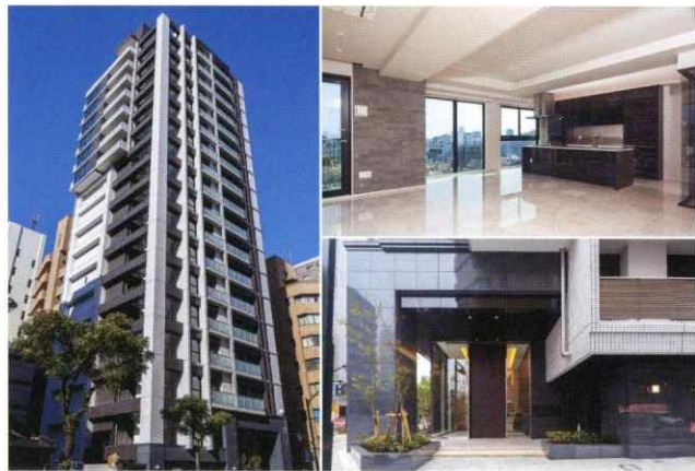
グレース織町タワー 新築工事