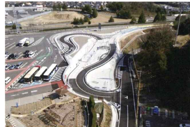
山陽自動車道 福山SAスマートインターチェンジ工事

人々の暮らしに大きく関わり、次世代への財産にもなる社会基盤づくりは、適切な維持管理と更新が不可欠です。巨大プロジェクトの成功にも携わる者が些細なことでも疎かにせず継続し、地道に取り組んだ過程があるから土木事業は広範囲にわたります。人々の安全と安心を守り地域に貢献すること。それも三島産業の大切な責務です。