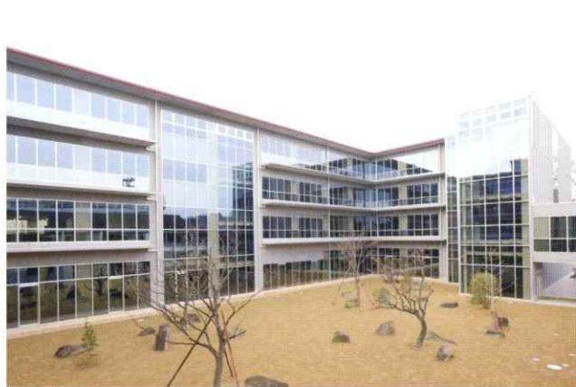
盈進高等学校校舎 耐震改築事業工事

「建築物をつくること」それは同じ工事内容でも土地の地形や地質・気象、又、お客様の多様なニーズによって現場の条件は異なります。言ってみれば私たちがつくるものは世界でひとつだけの建物。そこには地域の中で実績を重ね、信頼を高めてきた三島産業の、臨機応変な対応力とノウハウが注ぎ込まれています。未来にカタチを残す責任を忘れずに、「お客さまの要望に応えること」それが私たち三島産業の役割だと考えています。