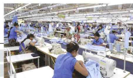
ミャンマー Myanmar Postarion Co., Ltd. (Shwepyithar Matsuoka Factory)