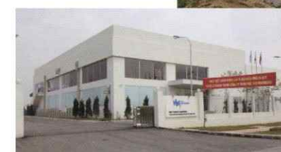
ベトナム Phu Tho Matsuoka Co.,Ltd.