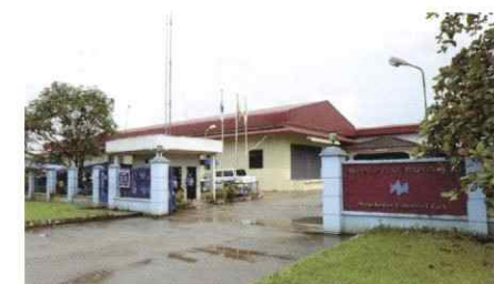
ミャンマー Myanmar Postarion Co., Ltd. (Mingaladon Matsuoka Factory)