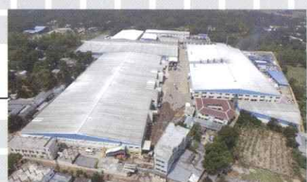
バングラデシュ TM Textiles & Garments Limited.