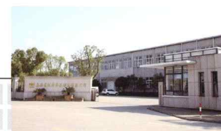
中国 嘉興榮織華華為制衣有限公司