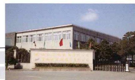
中国 嘉興徳永紡織品有限公司