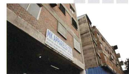
バングラデシュ MK Apparels Limited.