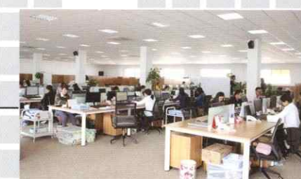
中国 浙江榮織華貿易有限公司 平湖事務所