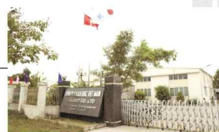
ベトナム VINA BIRZ Co.,Ltd.