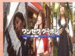
日テレ ワンセグクーポン紹介