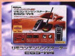
ミツバ EGS-W4 店頭プロモーション