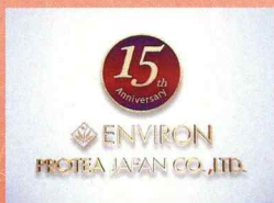
プロティアジャパン 15周年式典映像