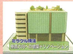
ミラクルスリー 工法紹介映像