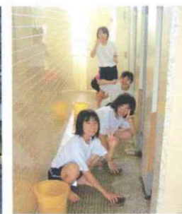
卒業記念トイレ磨き