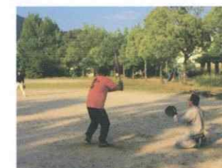
ソフトボール大会