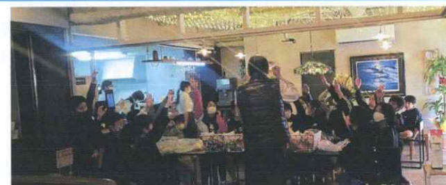
こども食堂「土曜ふおーらむ」