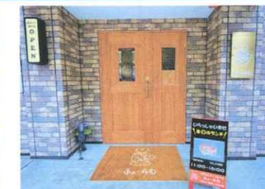
コミュニティCafé「ふおーらむ」

コミュニティCafé「ふおーらむ」では週替わりランチ&ドリンクバーを500円でご提供。こども食堂「土曜ふおーらむ」は小・中学生は5円(ご縁)65歳以上は45円(始終ご縁)でお腹もいっぱい、笑顔もいっぱい！