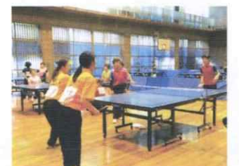
マルコシ主催地域卓球大会