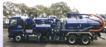
パワープロベスター