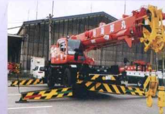
ラフタークレーン