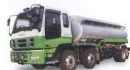
黒油タンクローリー