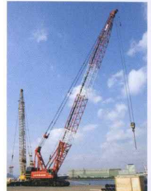
クローラクレーン

建設土木工事等のあらゆる現場で活躍する各種移動式クレーン部門。工場等のラインや設備、重量物、長尺物などの運搬から据付けまで通し、一貫した工事を全て弊社で対応させていただきます。