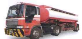
白油タンクローリー