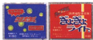
「ケミホタル」「ぎょぎょライト」 (1979~1980年発売)