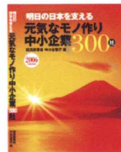
経済産業省 「明日の日本を支える元気な モノ作り中小企業300社」 表紙(2006年)