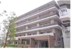
悠楽里レジデンス六本木