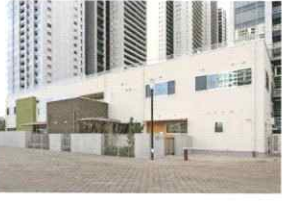
ゆらりん港南緑水