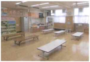
キッズ・プラザ白桜及び白桜学童クラブ