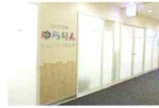
ゆらりん豊洲フロント