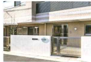
ゆらりん大泉学園