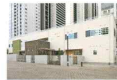
ゆらりん港南緑水