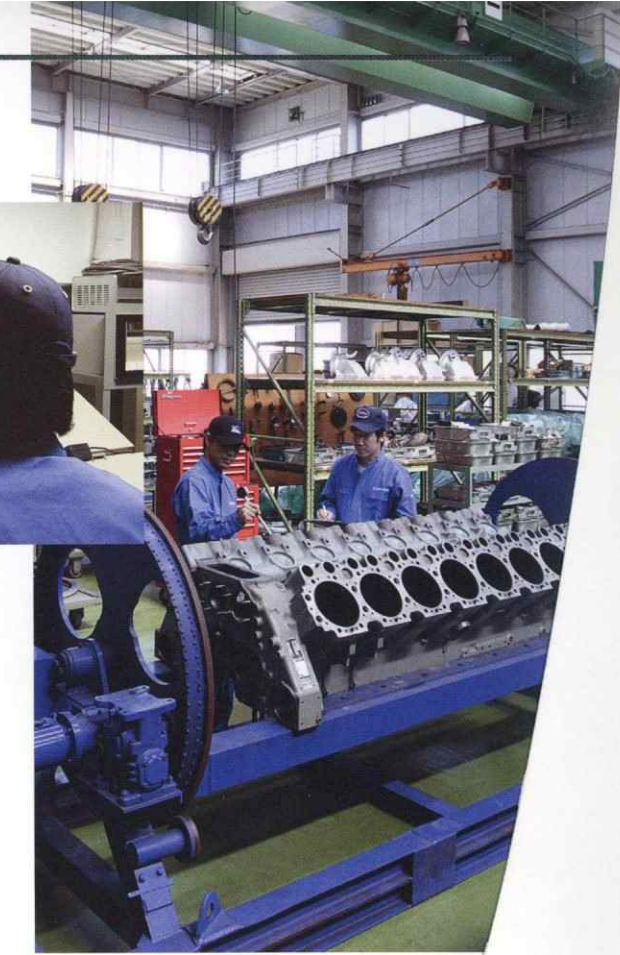
ディーゼルエンジン分解整備場