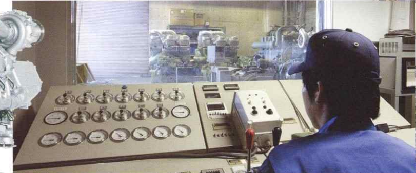
ディーゼルエンジン負荷試験の遠隔操作室