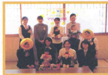
育休中の職員向けセミナーの様子

女性の育休取得率は100%。育休中もフォローを行い、復帰しやすい環境づくりに努めています。また呉市広に認定保育園を設けており、職員のお子さんも受入れています。