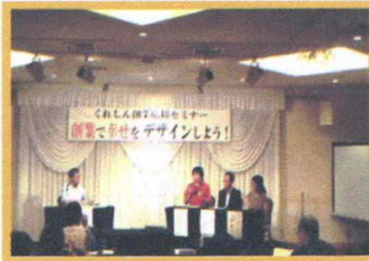
くれしん創業応援セミナー