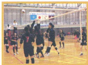
バレー部の試合の様子