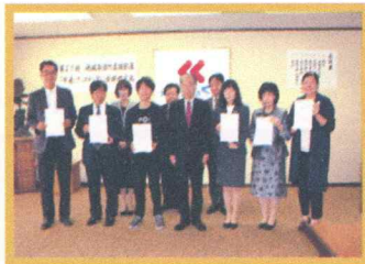
アクティブベースくれの助成金交付式

くれしんが全面支援するNPO法人を通じて助成金をお渡ししたり、創業セミナーを開催したり、商工会議所等の団体と創業支援ネットワークを作るなど、創業に関するさまざまな機会を提供しています。