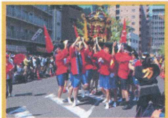
呉みなと祭のパレードに参加

日々の業務に加え、地域のお祭りやイベントに参加して、地域の方のお手伝いをする・盛り上げることで地域貢献しています。