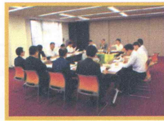
創業支援ネットワーク