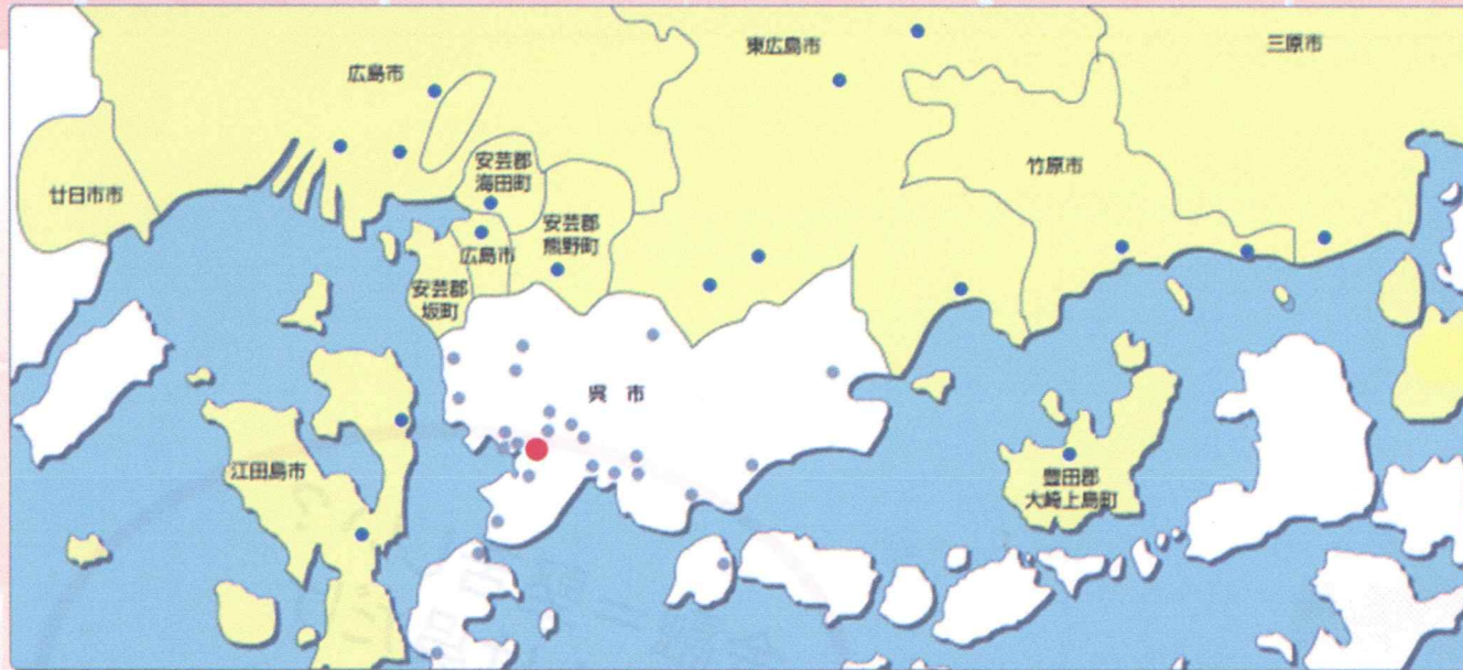
店舗配置図 ○印が店舗を表しています。●は本店