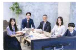
社内ミーティング