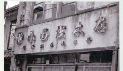
小西材木店の看板

そしてこの先も「創業時より続く結束力」と「時代に沿った柔軟な対応」で成長し続けます。