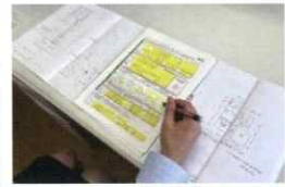
補助金申請サポート