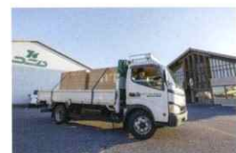
物流のワンシーン