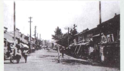
昭和初期の後藤駅通り

これを機に、関西方面へ銘木と言われる隠岐の黒松を販売することを業務とし、島で伐採された黒松を航路で境港まで回漕。境線の後藤駅前倉庫から主に大阪へ送り出していました。大正時代の大阪は様々な産業が興隆し、人口は大正14年で211万人と増加。米子も「山陰の大阪」と言われるほど大阪を手本として事業の基盤を形成していき、人口増加に伴い住宅関係、建材業の仕事も増加しました。