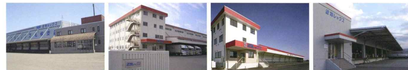
札幌支店 南大阪支店 羽生支店 京都支店

12,172kmに広がる、安心と信頼のKINBUTSUネットワーク。 全国にきめ細かく展開した自社路線・連絡路線と倉庫で、皆様のビジネスのスピードアップと 合理化のお役に立ちます。