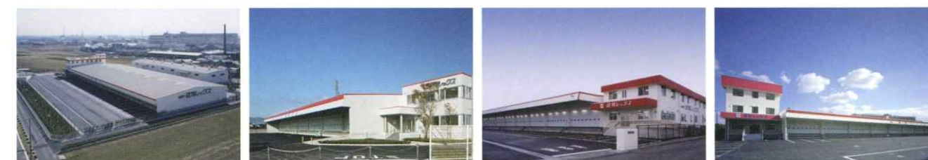
厚木支店 長野支店 松阪支店 名古屋支店