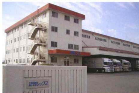
路線便ターミナル