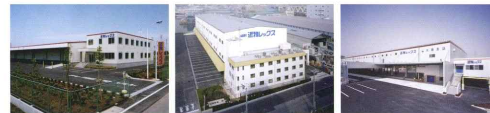
さいたま支店 横浜支店 大阪支店