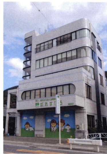
KCS2ndビル あすなろ本社