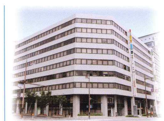
カワニシホールディングス

カワニシホールディングスは、 グループ全体の企業価値の最大化を図り、 医療・ライフサイエンスの発展に寄与します。