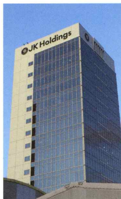
本社ビル「新木場タワー」