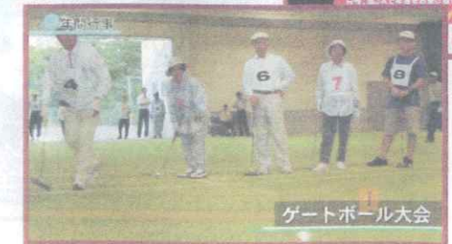
ゲートボール大会