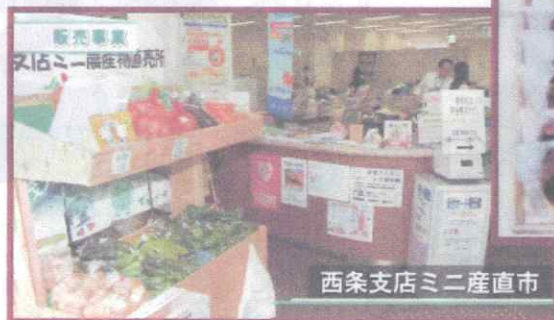
西条支店ミニ産直市