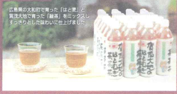
広島県の大和町で育った「はとむぎ」と賀茂大地で育った「緑茶」をミックスし、すっきりとした味わいに仕上げました。